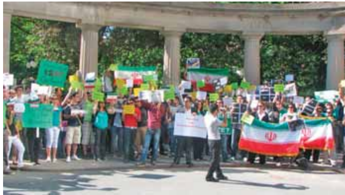
▲ عکس از هفته