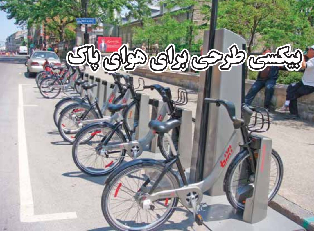
▲ یک ایستگاه بیکسی در مونترال

امروزه آلودگی هوا به عنوان یکی از جدی ترین مشکلات محیط زیستی شهرها محسوب می شود. این معضل در مناطق پرتردد و مرکزی شهرها حاد تر بوده و در بسیاری از موارد سلامتی شهروندان به خصوص کودکان و افراد مسن را به طور کاملاً مستقیم تهدید می کند. برنامه های متنوعی مانند طرح های محدودیت حمل و نقل ماشین های شخصی، تشویق به استفاده از وسایل حمل و نقل عمومی، تشویق به کاهش سفرهای درون شهری و رانندگی هوشیارانه برای کاهش مسیرها، در شهرهای مختلف دنیا برای کاهش آلودگی هوا تنظیم و برنامهریزی شده است. همچنین در چند ماه اخیر طرح استفاده از سیستم دوچرخه های عمومی در مونترال آغاز شده است.