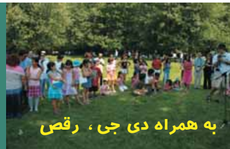
به همراه دی جی ، رقص

اطلاعیه منتشر شده در یکی دیگر از نشریه‌های مونترال، که اطلاعات دیگری در این رابطه می‌دهد به اشتباه چاپ شده است.