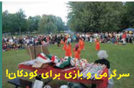
سرگرمی و بازی برای کودکان!