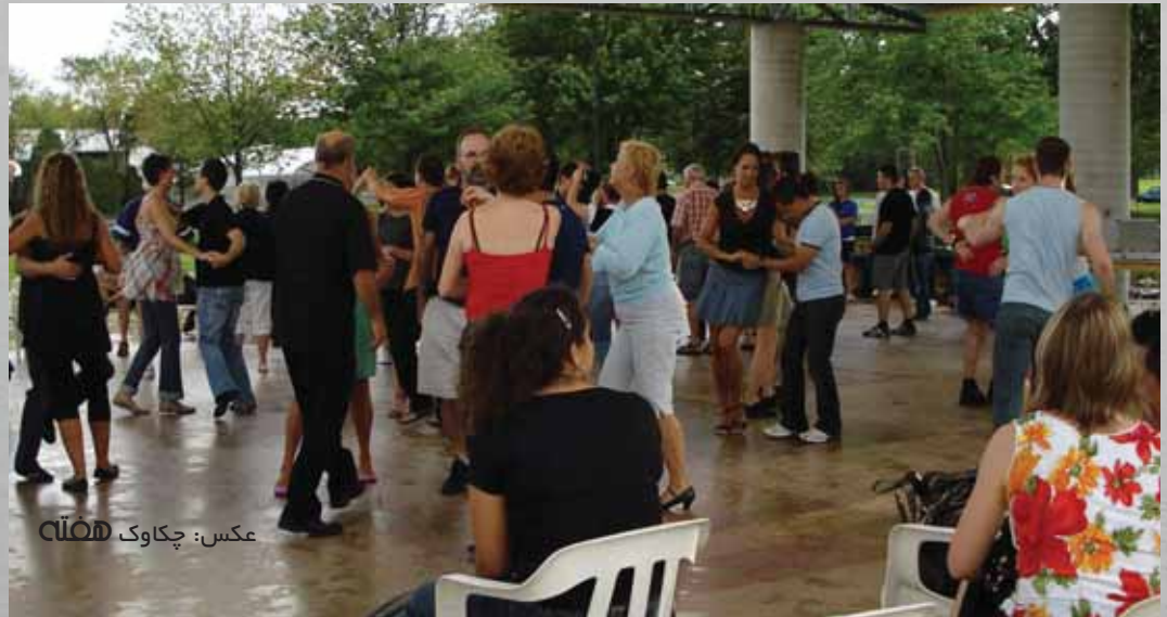
▲ دوشنبه ۱۶ ژوئن (رقص Salsa)