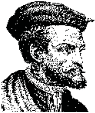
ژاک کارتیر، در سال ۱۵۳۴ اولین صلیب را در کانادا نشانده.

تا سال‌های پس از جنگ جهانی دوم نیز حاکمیت کبک عمدتاً از سوی کلیسای کاتولیک هدایت می‌شد. تنها در دهه ۶۰ بود که مدرن‌سازی کبک تحت رهبری حزب لیبرال به روندی ثابت و پایدار بدل گشت و کلیسای کاتولیک را عملاً به حاشیه راند. در همین دوران بود که کارزارها و برنامه‌های فشرده‌ای هم برای حمایت از زبان فرانسوی و تقویت آن در برابر زبان انگلیسی آغاز شد. این فعالیت‌ها چه به لحاظ اشاعه و یک‌دست‌سازی