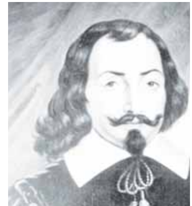
ساموئل شامپلن، بنیادگذار کبک سیتی

کبک به لحاظ مساحت بزرگترین استان کانادا است و تنها استانی است که زبان فرانسه تنها زبان رسمی آن است. این بخش از کانادا در عین حال بسیاری از سنن فرانسوی و همچنین قوانین مدنی سیستم حقوقی فرانسه را حفظ کرده است. در حالی که ناسیونالیسم نقش بسیار بزرگی در زندگی سیاسی و اجتماعی استانی که ما در آن زندگی می‌کنیم بازی می‌کند، هر سه حزب اصلی در اینجا بر خودمختاری بیشتر تاکید می‌کنند. دولت‌های طرفدار جدایی کبک، تا به حال دو بار در سال‌های ۱۹۸۰ و ۱۹۹۵ رفراندوم برگزار کردند