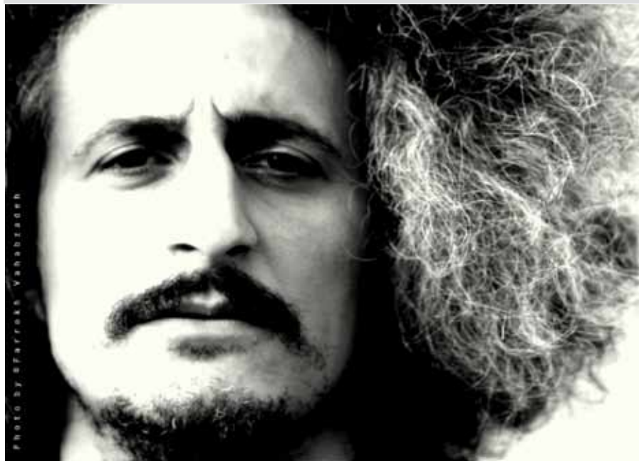
محسن نامجو

و همه در خدمت رساندن یک حس و انتقال یک مفهوم است. چاشنی طنز و صدای خنده شنوندگان در همه اجراهای زنده‌اش رکنی جدایی‌ناپذیر است. طنز او اگرچه تلخ و در راستای نتیجه‌گیری‌هایی ترازیک است، اما همین طنز، آثار او را جذاب‌تر و تأثیرگذارتر می‌کند. البته از سویی دیگر این کلمات و اصواتی که گاه شوکه‌مان می‌کند و ورای انتظار شنونده‌ی اتوکشیده است، باعث شده تا عده زیادی کارهای نامجو را جلف، بی‌ادبانه، سبک و توخالی بخوانند. در موسیقی‌هایی که او بر اشعار کلاسیک گذاشته، محور، تغییر در نوع نگاه به شعر و هجاهای آن است. او می‌خواهد «زلف بر باد مده...» حافظ را چنان بخواند که خودش می‌خواهد؛ با تأکیدها و سکونهایی که به موسیقی‌اش بیاید. نمی‌خواهد نوای سازش دل ای دلی باشد، بر زیر وزن شعری که سالهاست یکسان می‌خواندش. «دل ای دل»ش را هم آن‌سان که دلش می‌خواهد می‌خواند. جدا از چهارچوب نمی‌دانیم از کجا آمده.