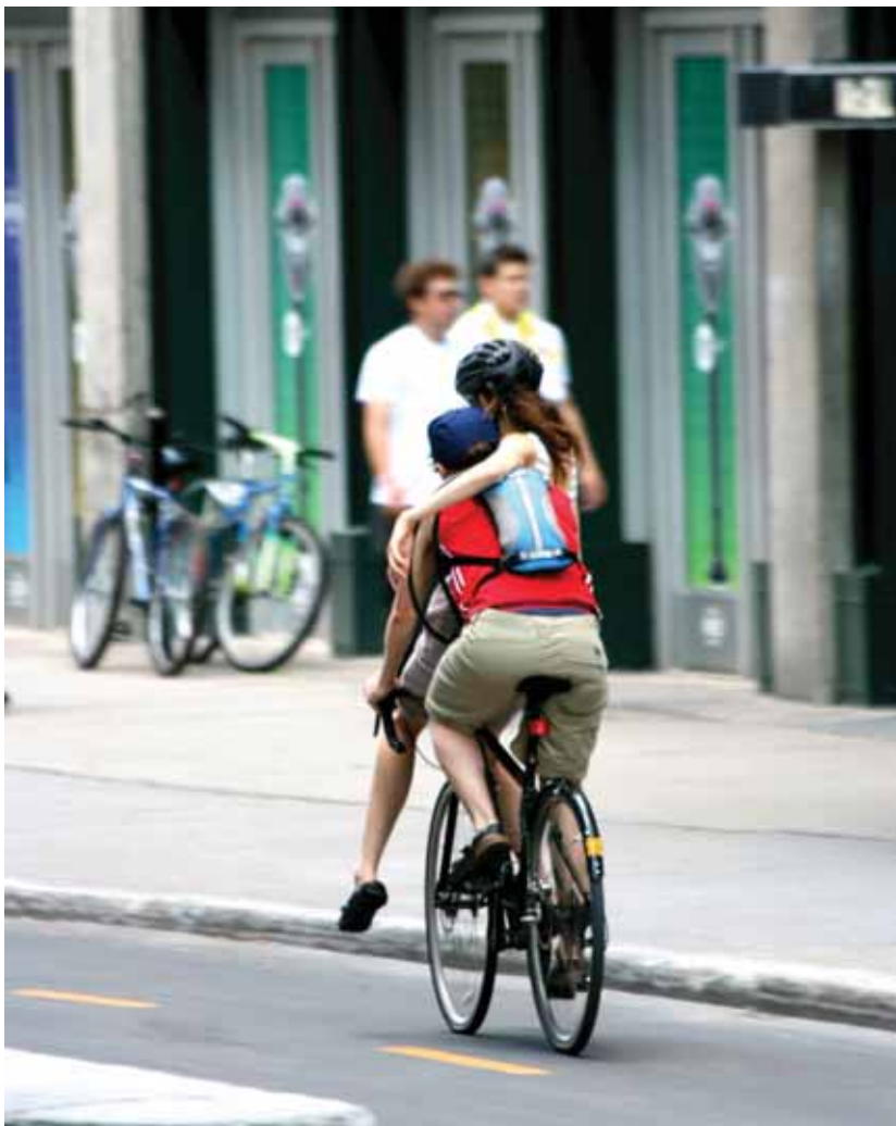
Un après-midi / یک بعدازظهر