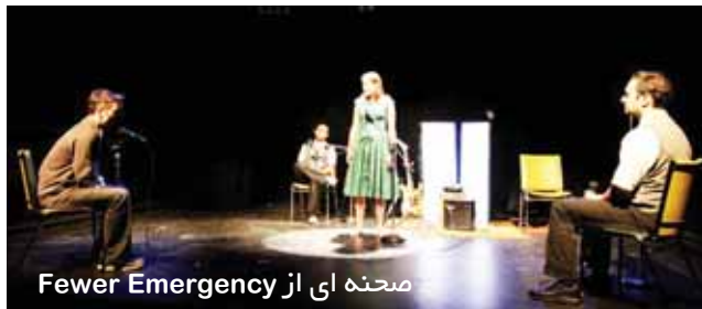
صحنه ای از Fewer Emergency

است. نویسنده هیچ کلیدی برای بازیگر نگذاشته است. این چیزی ست که کار را مشکل می کند.»