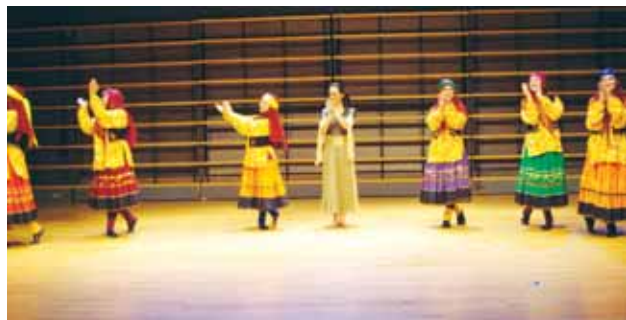
هنرمندان "رقصی چین" در پایان برنامه - هفته