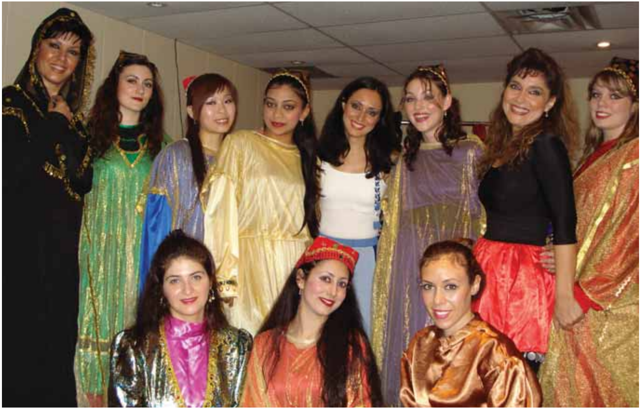
عکس از هفته