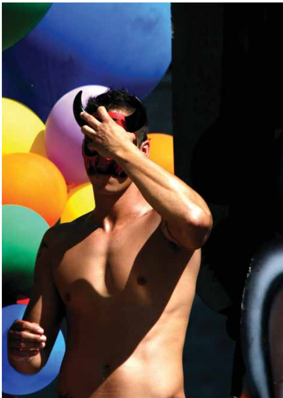
فستیوال دگرباشان / La parade gay