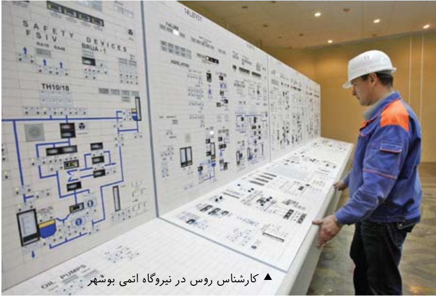
▲ کارشناس روس در نیروگاه اتمی بوشهر

نویسنده در انتهای مقاله می‌نویسد، اگر استاکس نت برای هدف خاصی طراحی شده پس چرا در سراسر جهان منتشر شده است؟ لانگر معتقد است که این کرم ممکن است توسط حافظه USB به وسیله یکی