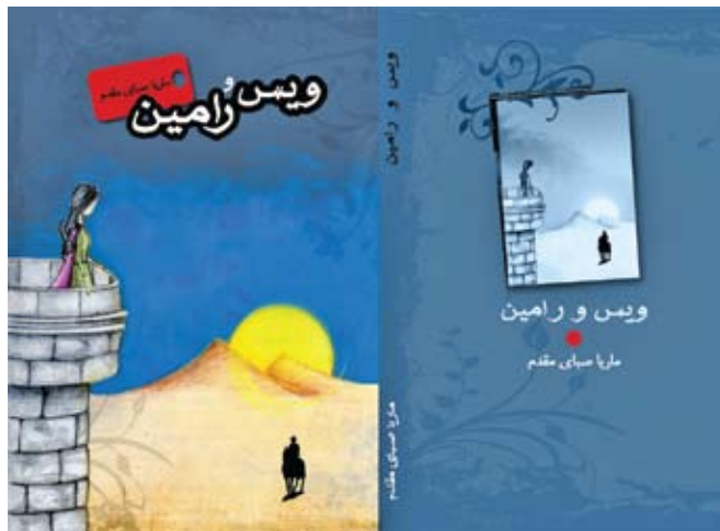
▲ طرح از غزل رضوی

رامین را می بیند که همچون خورشید، همراه با طلوع آفتاب از شرق به سوی او اسب می راند، طراحی شده است.