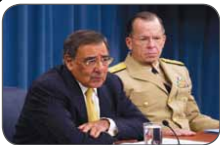
پانها تا وزیر دفاع ایالات متحده اسرائیل در بهار به ایران حمله خواهد کرد

اما هر چه از اقدام به تحریمها می‌گذرد و هرچه می‌شنویم از «حمله نظامی به ایران»، با مخالفت کارشناسان بیشتری روبه‌رو می‌شویم. گویی این کارشناسان به یقینی رسیده‌اند از باب حمله نظامی به ایران، درست به همان اندازه که سپاه به آن یقین رسیده است.