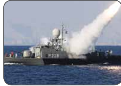
نیروی دریایی ایران در حال آزمایش یک موشک دریا به دریا

مسأله غنی‌سازی‌ها و تلاش ایران برای دستیابی به سلاح هسته‌ای، به دلیل آن که سر نخ آن به آژانس بین‌المللی انرژی اتمی می‌رسد مسأله‌ای ذاتاً بین‌المللی است درحالی‌که تحریم‌ها ناشی از اراده غرب، و به‌ویژه آمریکا هستند. اینجا تضادی است که باید آن را دریافت.