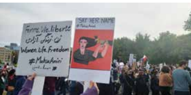
تظاهرات ۱۵ هزار نفری ایرانیان مونترال، اول اکتبر ۲۰۲۲