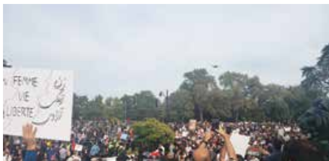
تظاهرات ۱۵ هزار نفری ایرانیان مونترال، اول اکتبر ۲۰۲۲ / عکس از هفته

مردم سراسر جهان اعم از ایرانی و غیرایرانی، در حال مشاهده این اعتراضات