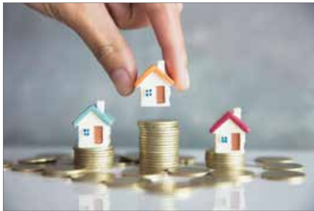
با وجود نرخ نزولی بهای مسکن، شهرداری‌ها برای دریافت مالیات بیشتر، بهای املاک مسکونی را نسبت به شرایط بازار بالاتر بردند.

البته نباید فراموش کرد که تنها افزایش بهای املاک نیست که توان مالی خریدار را کاهش می‌دهد، بلکه با افزایش اخیر در نرخ بهره بانکی و همین‌طور نرخ بررسی ریسک مالی یا استرس تست نیز قدرت خریدار کم می‌شود. بنابراین هردوی این عوامل دست‌به‌دست هم داده‌اند تا آرزوی بخش قابل‌توجهی از طبقه متوسط برآورده نشود. با افزایش سه درصدی نرخ بهره بانکی از ماه مارس گذشته تاکنون، نرخ بهره ثابت وام مسکن در ماه ژوئن به ۵ درصد رسید که در ۱۲ سال گذشته بی‌سابقه است.