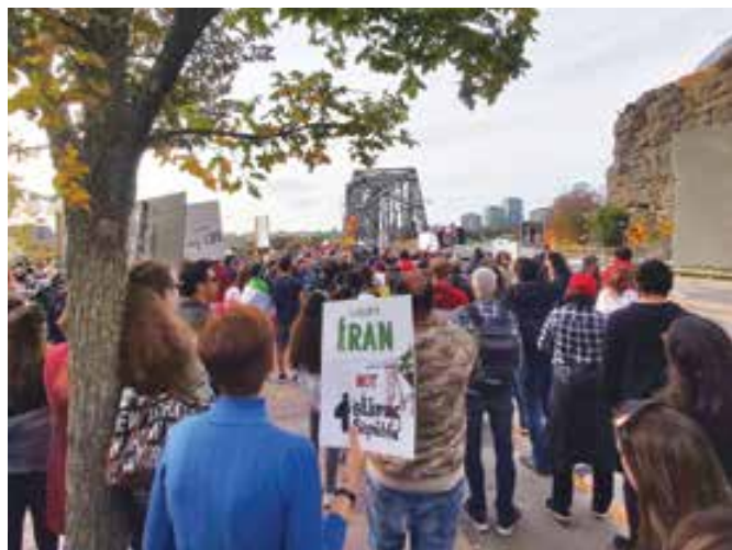
تظاهرات چندین هزار نفری ایرانیان اتاوا، اول اکتبر ۲۰۲۲