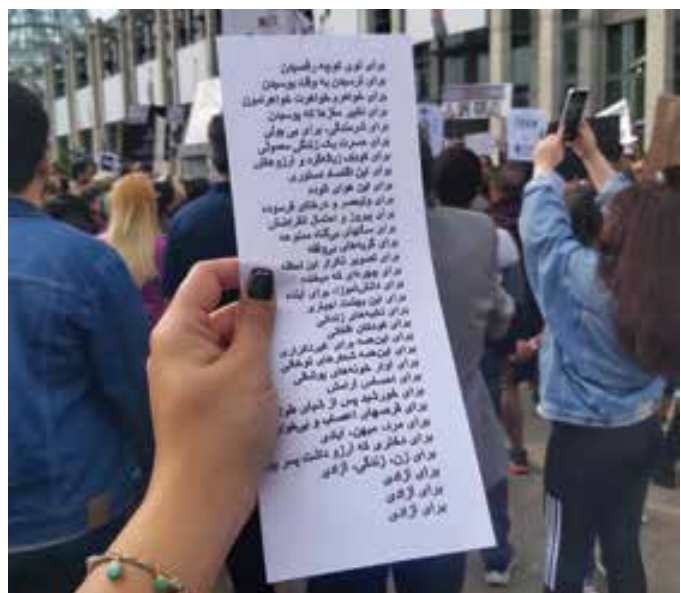
تظاهرات چندین هزار نفری ایرانیان اتاوا، اول اکتبر ۲۰۲۲