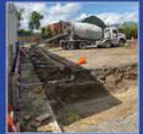
Parya Construction Site - September 2022