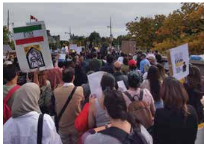
تظاهرات چندین هزار نفری ایرانیان اتاوا، اول اکتبر ۲۰۲۲