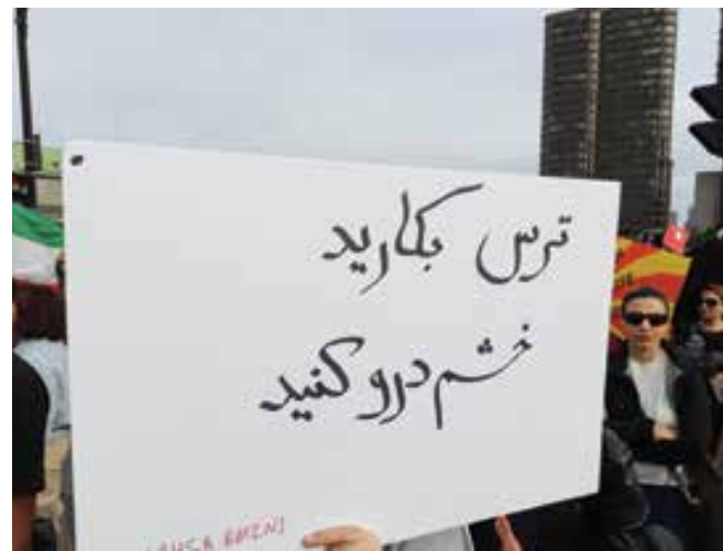
تظاهرات ۵۰ هزار نفری ایرانیان در تورنتو، اول اکتبر ۲۰۲۲