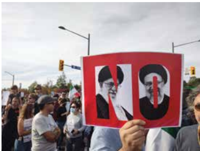
تظاهرات ۵۰ هزار نفری ایرانیان در تورنتو، اول اکتبر ۲۰۲۲

من هر کلمه از این شعار «زن، زندگی، آزادی» را با عمق جان می‌فهمم. این سه مورد، اصول و پایه زندگی هستند. این حق زن است که از زندگی آزادانه برخوردار باشد. زیرا گذاشتن این حق طبیعی، ظلم است و شرم‌آور است. نادیده رفتن این حق، سومی است که خلاف نحوه تولد آبدانه ماست، زیرا هرکسی آزاد به دنیا می‌آید، تا زمانی که پای قوانین اجباری مردسالارانه به میدان می‌آید. در واقع زنان فقط برای به دست آوردن چیزی که با آن به دنیا آمده‌اند، در حال نبرد هستند و آن زندگی آزادانه، بدون هراس و محکومیت تحمیل شده توسط رژیم است.