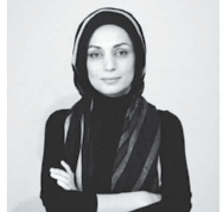
سیمین کرامتی هنرمند ایرانی مقیم تورنتو