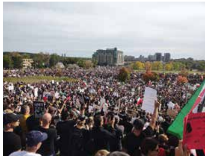
تظاهرات ۵۰ هزار نفری ایرانیان در تورنتو، اول اکتبر ۲۰۲۲