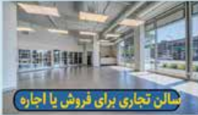
سالن تجاری برای فروش یا اجاره

مساحت: ۱۴۰ مترمربع در منطقه شلوغ Jean-Talon.