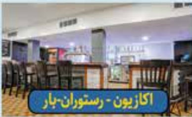
اکازیون - رستوران-بار