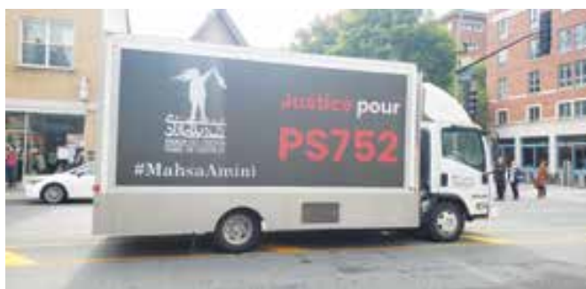
تظاهرات ۱۵ هزار نفری ایرانیان مونترال، اول اکتبر ۲۰۲۲ / عکس از هفته