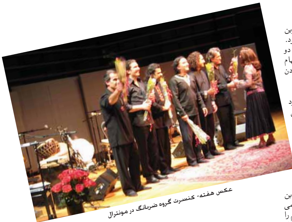
عکس هفته - کنسرت گروه ضربانگ در مونترال

ماهانمه ماندگار در ادامه می نویسد: «درخشانترین ستاره در موسیقی قوالی نصرت فاتح علیخان بود. نصرت خان در تمام ترانه‌های عرفانی اش روی دو موضوع مذهب و خدا تمرکز می‌کرد و از آنها الهام می‌گرفت. تاریخ کهن قوالی پاکستان با از دست دادن نصرت فاتح خان دچار شوک عظیمی شد.