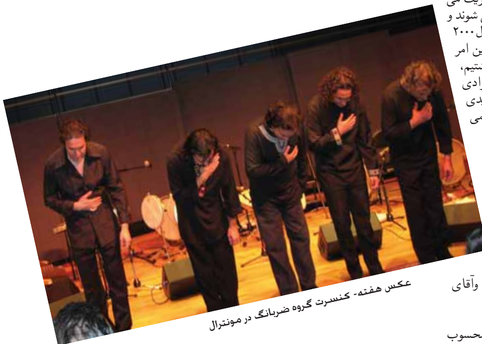
عکس هفته - کنسرت گروه ضربانگ در مونترال