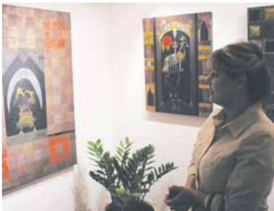
نمایشگاه خسرو برهمندی، هنرمند موتترالی - <