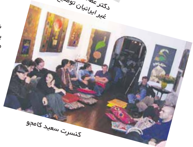
کنسرت سعید کامجو